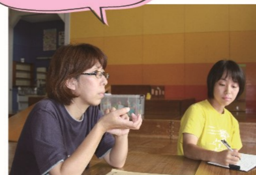
ピーターキッズ 様